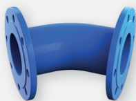
Kolano kołnierzowe 45° (1/8) (FFK)